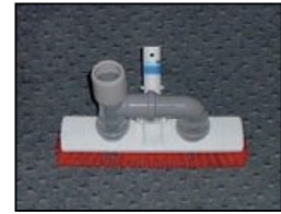
Saugbürste 300 mm breit