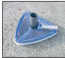
Dreiecksaugbürste für Boden