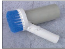
Saugbürste rund für Wand