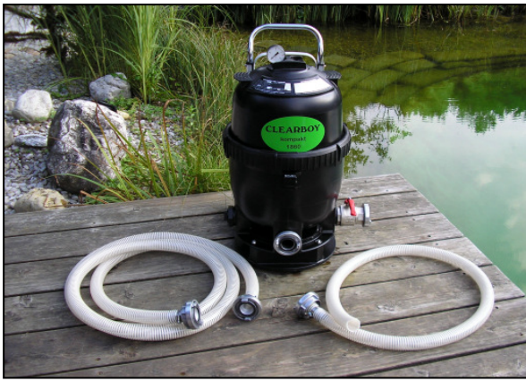
Zusätzliches Ausstattungspaket mit Filtereinheit Clearboy kompakt 1400 und 1860